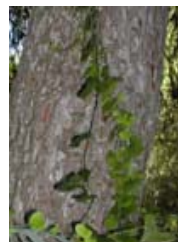
Zarzaparrilla. Aritjol. Smilax aspera .