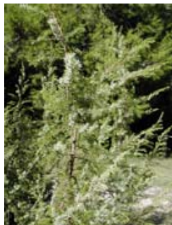
Enebro marino. Ginebre. Juniperus macrocarpa .