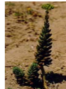
Uva de pastor. Raïm de pastor. Sedum sediforme.