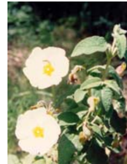
Jaguarzo Morisco. Estepa Borrera. Cistus salvifolius.