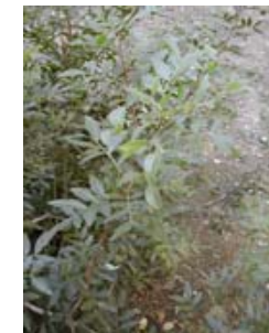
Lentisco. Llentiscle. Pistacia lentiscus .