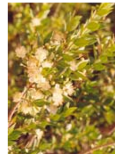
Mirto. Murta. Myrtus communis .