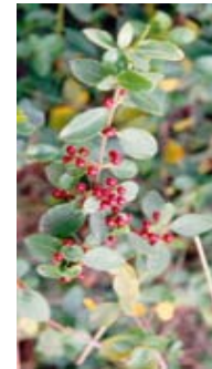
Aladierno. Aladern. Rhamus alaternus .