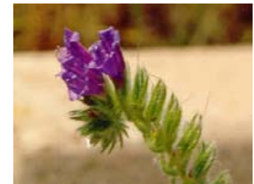
Viperina. Llengua de bou. Echium vulgare.