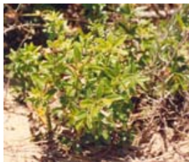
Rubia. Rapallengua. Rubia peregrina.