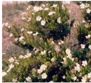
Romero macho. Esteperola. Cistus clusii .