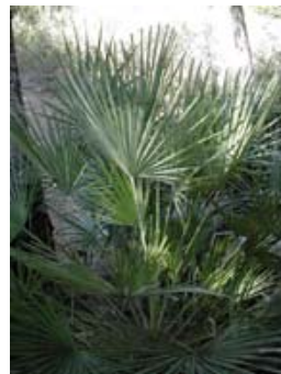
Palmito. Margalló. Chamaerops humilis .