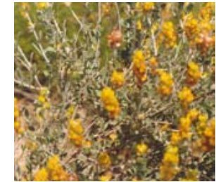
Albaida. Anthyllis cytisoides.