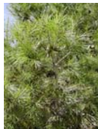
Pino carrasco. Pi blanc. Pinus halepensis .