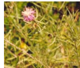
Bormaga. Bracera. Centaurea aspera.