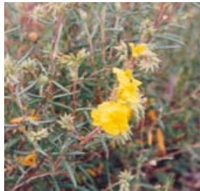
Jaguarzo Valenciano. Romer blanc. Helianthemum lavandulifolium.