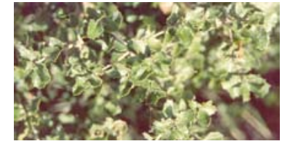
Coscoja. Coscoll. Quercus coccifera .