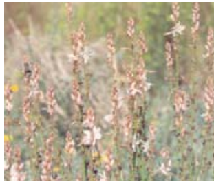
Gamón. Gamó. Asphodelus fistulosus .