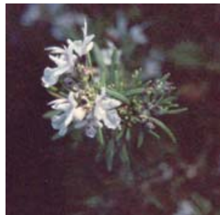
Romero. Romaní. Rosmarinus officinalis.