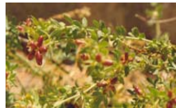
Bocha peluda. Botja peluda. Dorycnium hirsutum.