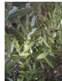
Labiernago. Aladern de fulla estreta. Phillyrea angustifolia .