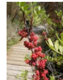
Fruto del Lentisco.