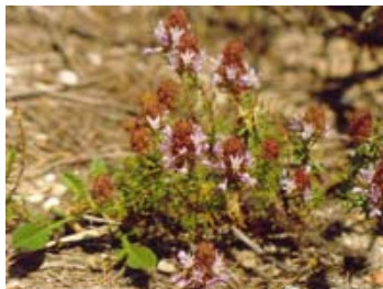
Pinzell. Coris monspeliensis.