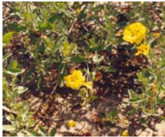
Jaguarzo. Estepa d'Arenal. Halinium Halimifolium.